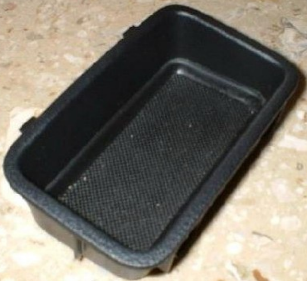
Dieses Ablagefach wird hinten vor dem Aschenbecher rausgehebelt!