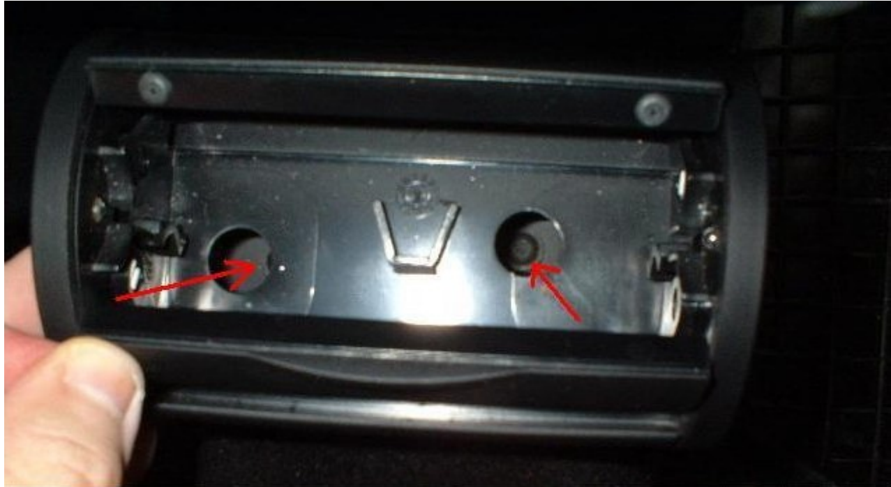
Der Aschenbecher wird herausgenommen und dann werden die zwei Schrauben herausgedreht um die Mittelkonsole abzunehmen!